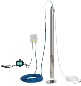
Wilo Beregnungspaket TWU 3 Plug & Pump Sub-I