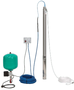
Wilo Berechnungspaket TWU 3 Plug & Pump Sub-II